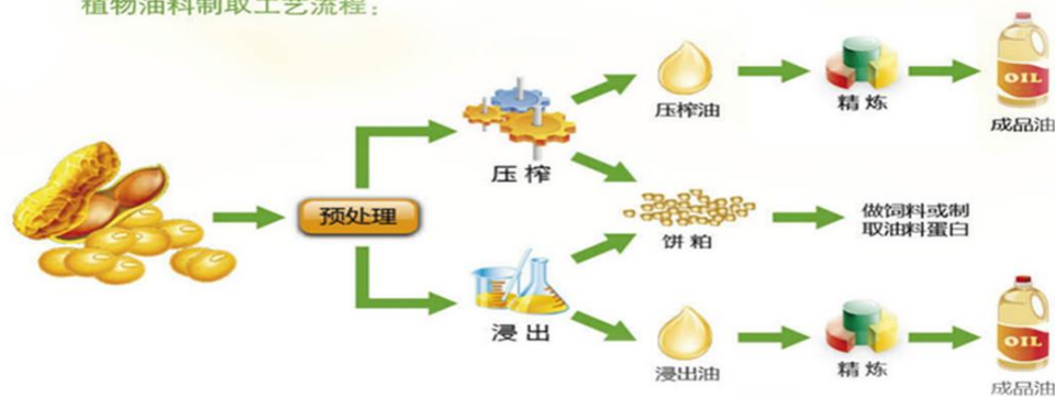
植物油料制取工艺流程：

食用植物油的好，不能单单只看外观是否清澈，颜色清淡，更要关注营养伴随物含量和危害物的多少。食用植物油的营养伴随物（包括甾醇总量及组成、生育酚及生育三烯酚、角鲨烯、多酚、谷维素、芝麻素等营养成分）与人体健康的关系十分密切，不同品种的油脂中营养伴随物的种类和含量差别较大。我国实施“优质粮食工程”首次在《中国好粮油 食用植物油》标准中设置植物油营养伴随物为标签标识的指标，引导植物油加工最大化的保留营养功能性成分，为消费者提供不同类型营养成分的健康产品，让消费者根据自身状况明明白白选择食用油，避免营养功能性物质长期摄入过低造成的健康隐患。